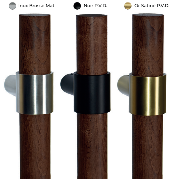
Les teintes du bois peuvent légèrement varier et se patiner à l'usage

* La certification PEFC repose sur la certification forestière qui atteste du respect des fonctions environnementales, sociales et économiques de la forêt, et également sur la certification des entreprises qui transforment le bois afin d'assurer la traçabilité de la matière depuis la forêt jusqu'au produit fini.